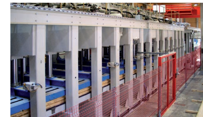
Durchlaufpresse Throughfeed Press