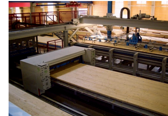
Kleberauftrag Glue Application