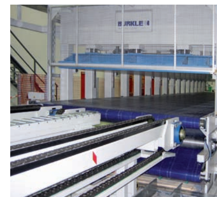
Presseneinlauf Infeed of press