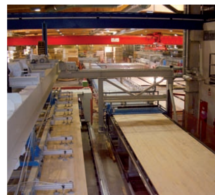
Bereitstellung Längslagen Provision of stiles