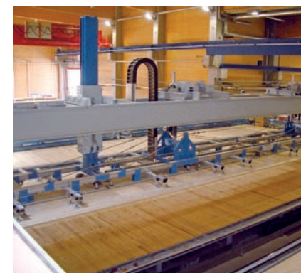
Legebereich Lay-up Area