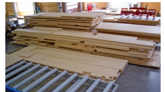
Elemente nach der Formatierung Elements after formatting